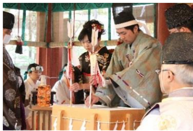
⑤成人としての誓いを立てます