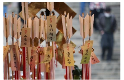
⑥祭典後、破魔矢をお渡し致します