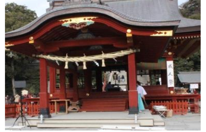
③舞殿へ移動します