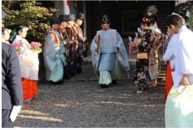
①神職に続いて進みます